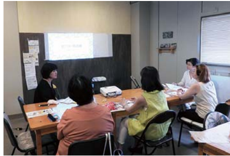
起業をめざす女性たちが 勉強会やワークショップを開き、学び合う空間